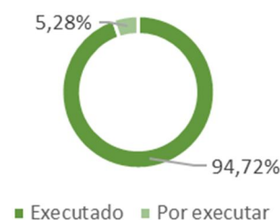
Taxa de execução

Apoio financeiro público nacional | 0,00 €